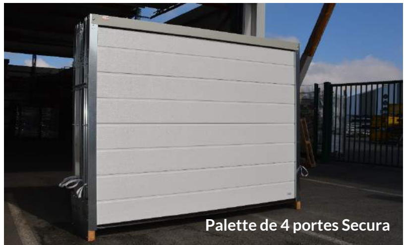
Palette de 4 portes Secura