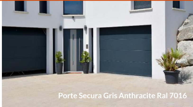
Porte Secura Gris Anthracite Ral 7016